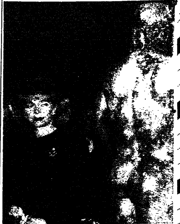
ملكة الأردن نور، لدى وصولها أمس الأول إلى متحف - القل - الروماني، في ليون حيث قامت بتدشين الفسيفساء البيزنطية.